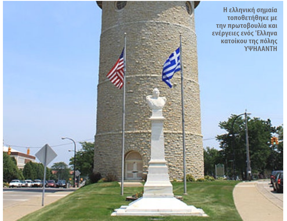
Η ελληνική σημαία τοποθετήθηκε με την πρωτοβουλία και ενέργειες ενός Έλληνα κατοίκου της πόλης ΥΨΗΛΑΝΤΗ

Κι αν κρίνουμε από το γεγονός ότι τελευταία ασχολούνται με οινο-καφενειακή πολιτική (γαστρονομία, δοκιμή κρασιών, μεζεδάκια και... ντολμαδάκια) σε πρεσβεία, προξενεία, γραφεία