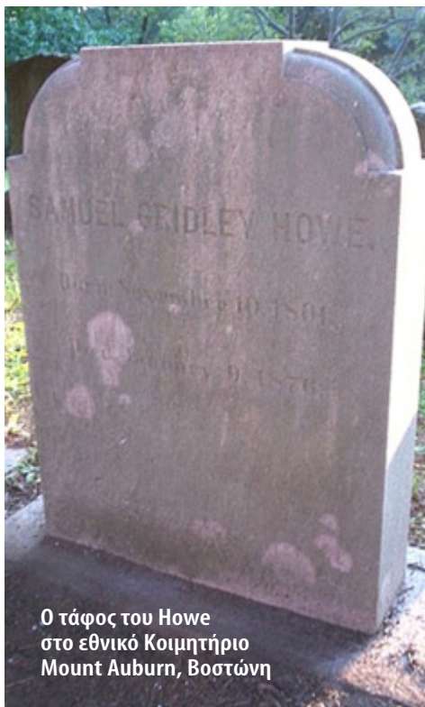
Ο τάφος του Howe στο εθνικό Κοιμητήριο Mount Auburn, Βοστώνη

Η Ελλάδα, ουδέποτε τίμησε την πόλη, αγνοεί πιθανά και την ύπαρξή της. Οι επισκεπτόμενοι το Σικάγο Έλληνες υπουργοί και πολιτικοί, ουδέποτε ενδιαφέρθηκαν. Πιθανά αγνοούν και την ύπαρξη της πόλης Υψηλάντη. Γιά τις τοπικές γραφικές και αστοιχείωτες ελληνικές Οργανώσεις (Σικάγου βασικά και Νητρώιτ) δεν χρειάζονται σχόλια.